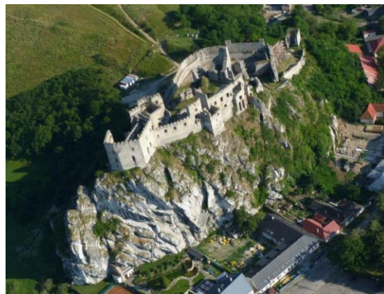
Hrad Beckov

prostredníctvom presadzovania vlastných kandidátov v jednotlivých grémiách cirkvi a ekonomického ovládnutia finančných tokov v ústredí cirkvi a kontroly finančných zdrojov zo štátu. Nejde tu len o prostriedky štátu určené na platy farárov a kaplánov. Nie malé zdroje od štátu prichádzajú priamo na ústredie cirkvi a po navrhovanej reštrukturalizácii, by malo ústredie kontrolu nad všetkými prostriedkami. Súčasná informácia o použití prostriedkov štátneho rozpočtu sú však nedostatočné. Transparentnosť je preto nevyhnutná!