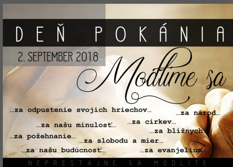
Grafika: Martin Melišík